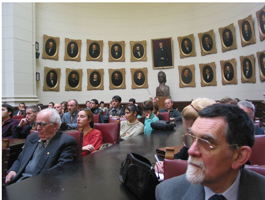
Fig. 7. Institutul de Arheologie „Vasile Pârvan”: 2. Adunarea festivă din 25 noiembrie 2004 în Aula Academiei Române.