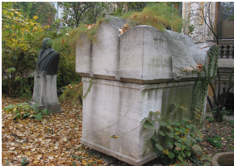
Fig. 6. Institutul de Arheologie „Vasile Pârvan”, 2004: 3. Lapidariul, cu bustul lui Vasile Pârvan.