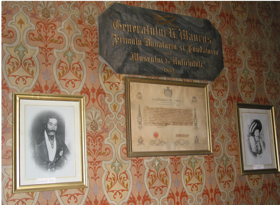
Fig. 6. Institutul de Arheologie „Vasile Pârvan”, 2004: 2. Biroul directorului.