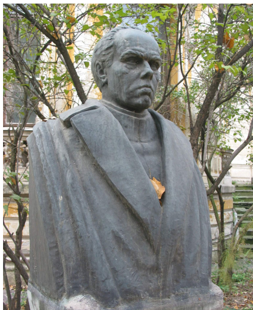
Fig. 7. Institutul de Arheologie „Vasile Pârvan”: 1. Vasile Pârvan (1882–1927) (foto M. Babeş).