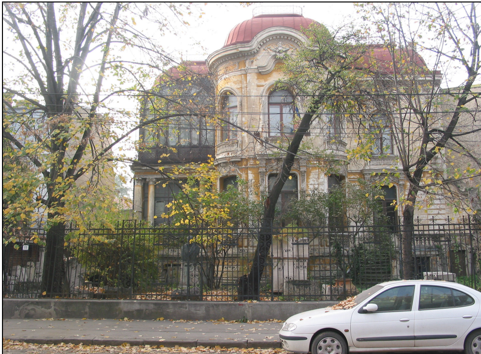
Fig. 6. Institutul de Arheologie „Vasile Pârvan”, 2004: 1. Casa Macca.

În 1931 Muzeul Național de Antichități s-a mutat, cu toate colecțiile sale, din localul Universității în casa Macca, pusă la dispoziție de reputatul istoric Nicolae Iorga, pe atunci prim-ministru. Era pentru prima dată când, după aproape un secol de la înființare, Muzeul dispunea de un local propriu, satisfăcând în bună măsură nevoile de depozitare, prelucrare științifică și muzeistică și expunere a descoperirilor arheologice. În acea casă din actuala stradă Henri Coandă nr. 11, se află și astăzi, ca urmaș al Muzeului, Institutul de Arheologie „Vasile Pârvan” (fig. 6). Pe aceeași linie de continuitate, trebuie arătat că la sfârșitul celui de-al II-lea Război Mondial (1945) schema organizatorică a muzeului prefigura deja în detaliu structura viitorului institut, cu secții de cercetare profilate pe criteriul cultural-cronologic (preistorie, epoca greco-romană, evul mediu), cabinet numismatic, bogată bibliotecă și arhivă științifică, cabinet de desen și cartografie, laborator de restaurare.