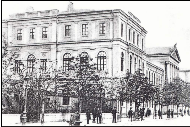
Fig. 3. Universitatea din Bucureşti – sediu al Muzeului Naţional de Antichităţi între 1864 şi 1931.