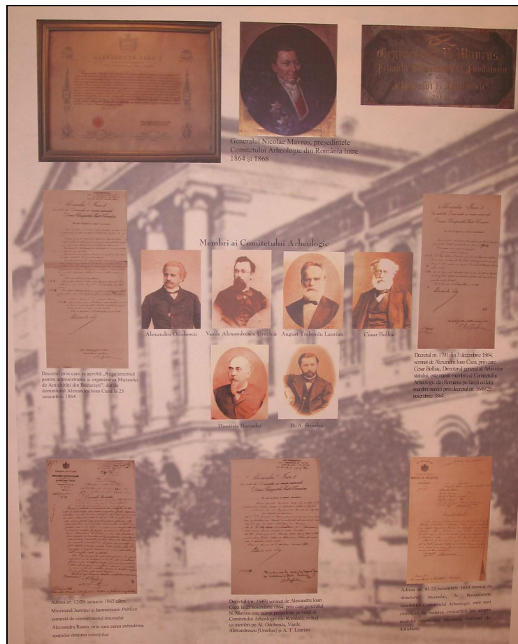
Fig. 4. Poster din expoziţia comemorativă de la Biblioteca Academiei Române (nov. 2004–ian. 2005): începuturile MNA, 1862–1868 (prelucrare digitalizată Andrei Măgureanu).