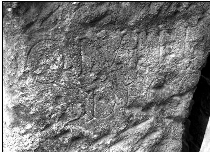
Fig. 5. Fotografia inscripției de pe baza de statuie de la Oescus.