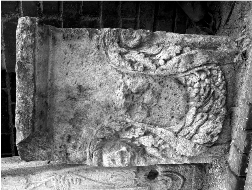
Fig. 4. Fotografiiile bazei de statuie decorată cu ghirlandă și capete de berbeci de la Oescus.