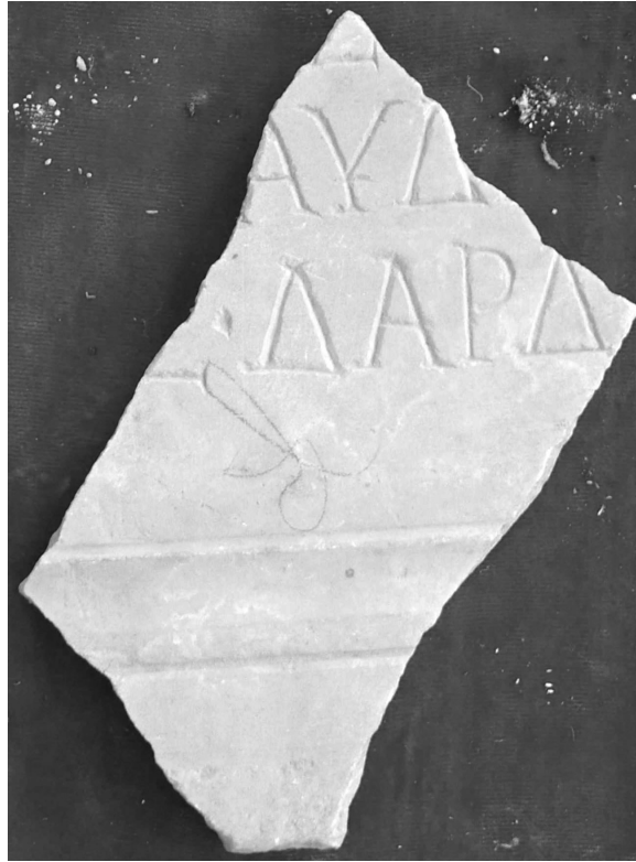
Fig. 3. Placa de marmură de la Histria cu mențiunea alei I Vespasiana Dardanorum .