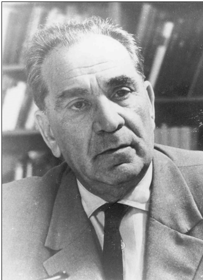
Fig. 1. Constantin Daicoviciu (1898-1973).