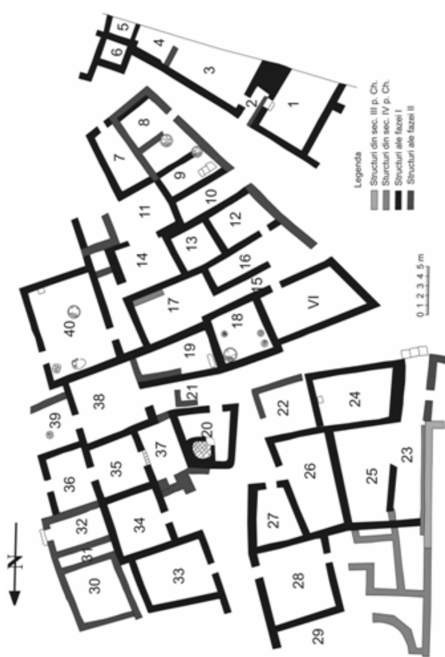
Fig. 4. Cartierul „cetate”, faza II (după G. Florescu).