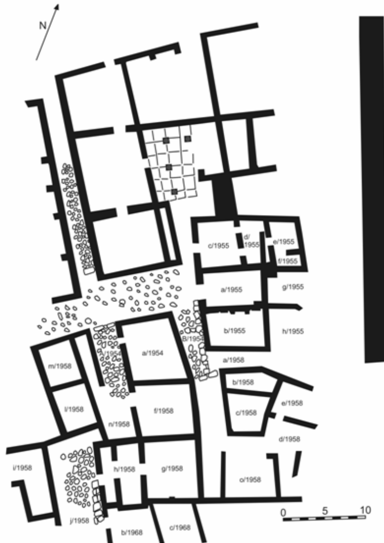
Fig. 2. Cartierul roman târziu din spațiul Zonei Sacre (după Iuliana Barnea).

ce nu are legătură cu „edificiu cu coloane”, fiind total separat de acesta, neexistând căi de comunicare directă cu niciuna dintre camerele lui. Nu excludem totuși o legătură din punct de vedere funcțional între cele două, având în vedere că pe latura de nord au ziduri comune, iar în secolul al VI-lea p. Chr. edificiul de tip domus pare să-și fi schimbat destinația, dacă nu în întregime, măcar parțial, unele camere fiind transformate în depozite.