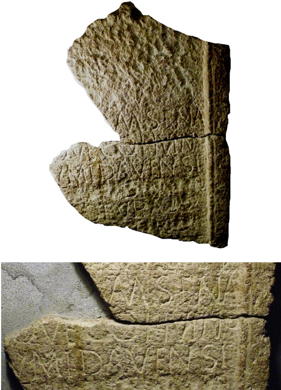
Fig. 3. Inscripția de la Râșnov – Cumidava.