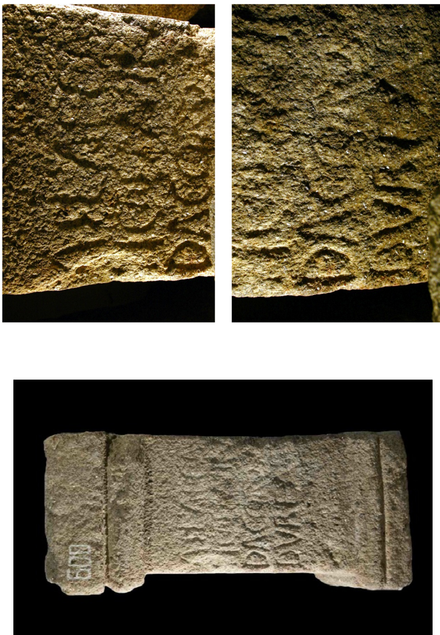
Fig. 5. Inscripția de la Vilar de Areias, Portugalia.