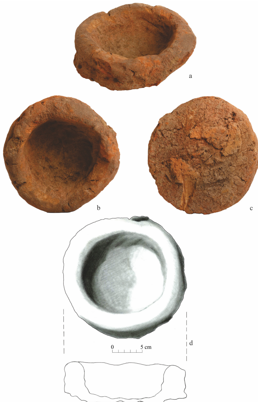
Fig. 4. Vatră portabilă din lut.