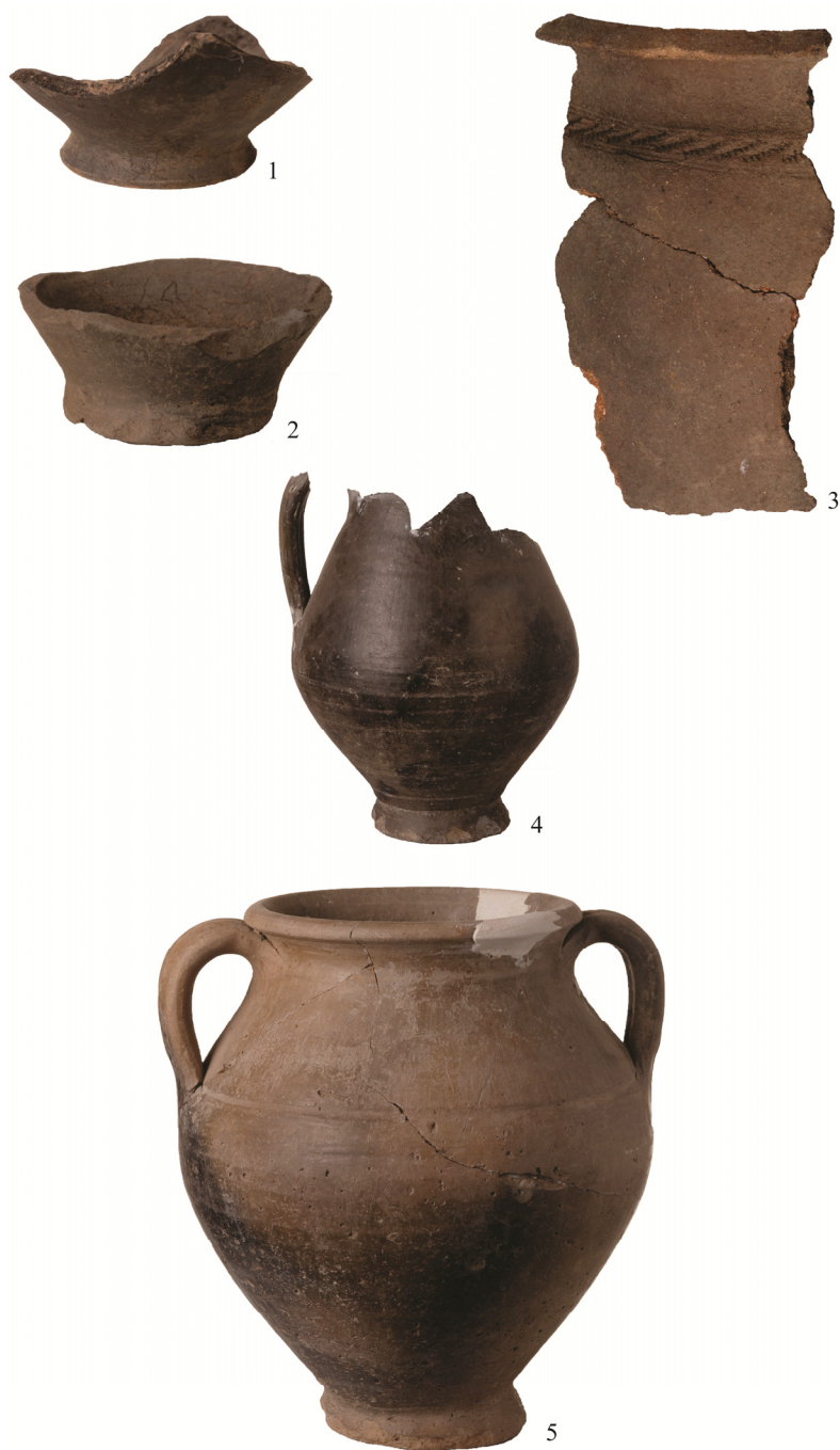
Fig. 3. Ceramică cenușie: 1-2. fragmente din partea inferioară a unor vase; 4. cană; 5. vas amforoidal; ceramică de culoare cărămizie: 3. fragment de vas.