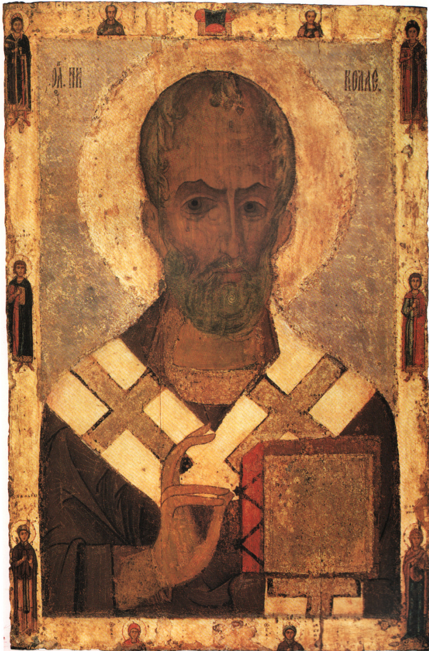
Fig. 6. Icoană din secolul al XII-lea sau de la începutul secolului următor, reprezentând, în plan central, bustul Sfântului Nicolae, flancat de imaginile miniaturizate ale mai multor sfinți (Boris, Gleb etc.), păstrată la Galeria Tretyakov din Moscova (foto V. Spinei, 2013).