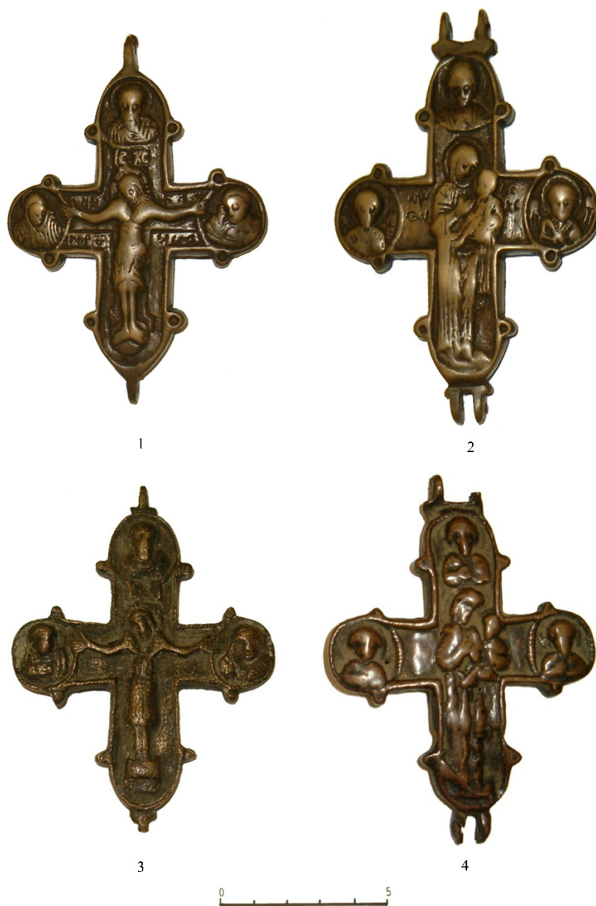
Fig. 3. Cruciuliță-encolpion din bronz de tip A, cu imaginea lui Iisus Hristos crucificat (1, 3) și a Fecioarei Maria cu Pruncul Iisus în brațe (2, 4), din secolele XII–XIII, aflate în colecțiile Muzeului de Istorie de Stat din Moscova.