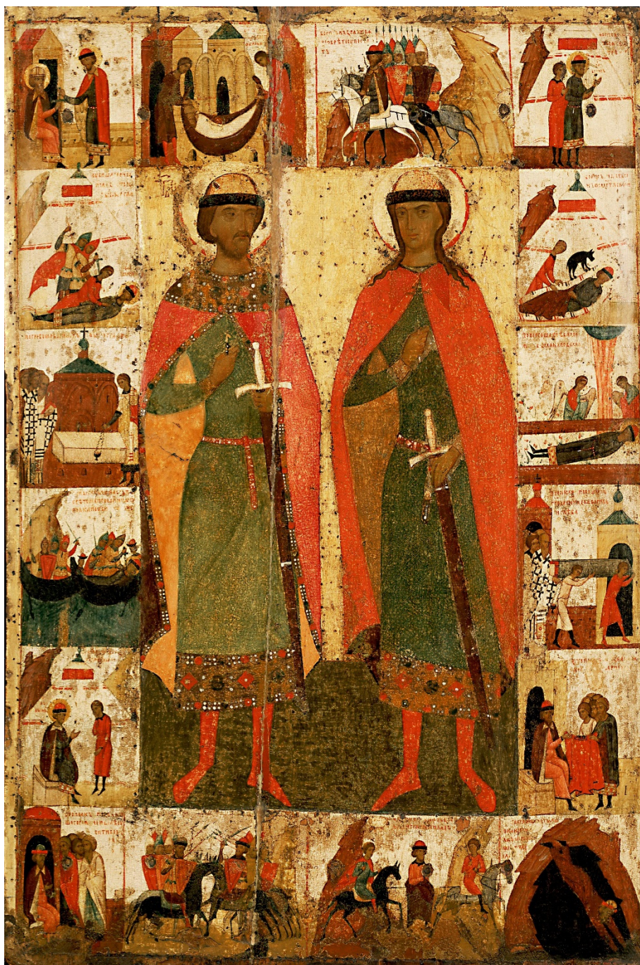
Fig. 5. Sfinții Boris și Gleb, figurați pe o icoană din a doua jumătate a secolului al XV-lea, provenind de la Moscova, păstrată la Galeria Tretiakov din Moscova.