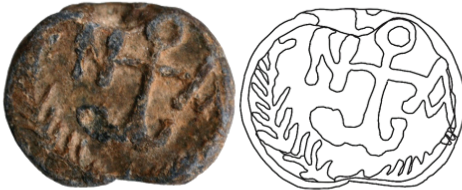
Fig. 2. Sigiliul lui Ioannes, descoperit la Fântâna Mare ( Başpunar ). Revers.

Datare: a doua jumătate a secolului al VI-lea.