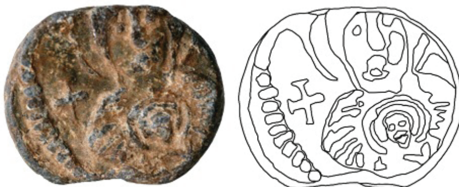
Fig. 1. Sigiliul lui Ioannes, descoperit la Fântâna Mare ( Başpunar ). Avers.

Revers: monogramă cruciformă (fig. 2). Legenda reversului este ușor descentrată spre dreapta sus. După cum am arătat mai sus, această descentrare a legendei se datorează unei neglijențe la ștanțarea plumbului. În centrul reversului, se află gravată o legendă, sub forma unei monograme cruciforme, care ascunde numele emitentului. Legenda cuprinde patru litere amplasate la capetele unei cruci. Hasta verticală a crucii este și una dintre cele cinci litere ale monogramei (I). În capătul de sus al hastei orizontale se află diftongul ov (8); în capătul de jos al aceleiași haste se află litera ω ; în capătul din dreapta al hastei orizontale se află litera a (A), iar în capătul din stânga al aceleiași haste se află litera n (N). Cele cinci litere (I, ω , A, N, 8) formează numele IΩAN(N)8.