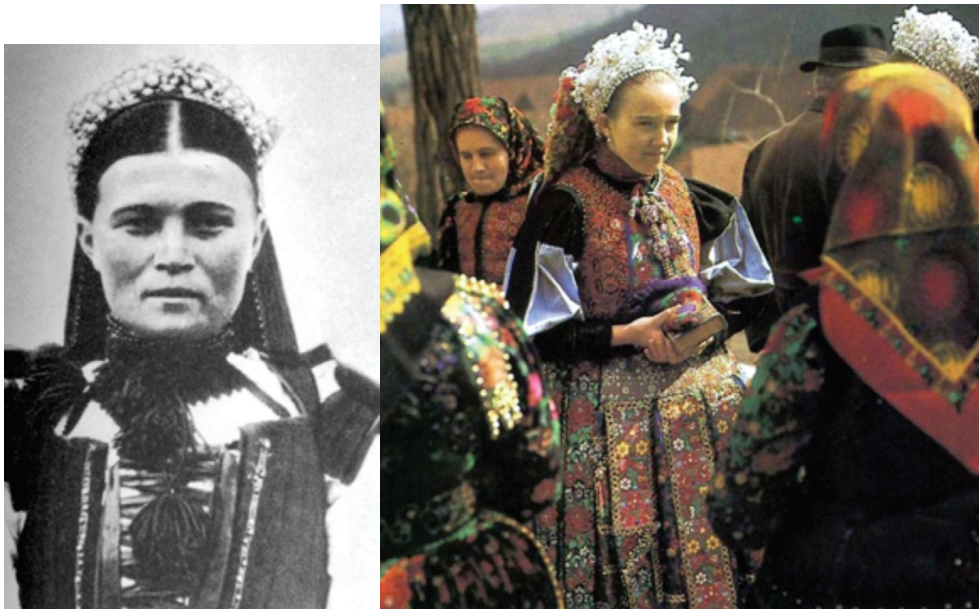
Fig. 2. Fete cu diademe decorate cu mărgel: a. Vulcani, jud. Cluj, 1894 ( http://mek.oszk.hu/02100/02115/html/img/4 ); b. Viștea, jud. Cluj, anii '70 ai secolului XX ( http://mek.oszk.hu/02100/02115/html/img/4-160r.jpg ).

opinia noastră, o analiză monografică a acestei categorii de artefacte din Bazinul Transilvaniei ne-ar oferi mai multe și mai detaliate informații socio-antropologice referitoare la realitățile epocii medievale.