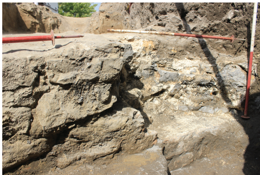
Fig. 13. Nufăru. Str. Ulmului, 2017. Tronson din cortina bizantină de nord, cu intervenția neautorizată din anul 2015 pentru reamplasarea stâlpului electric. Vedere dinspre sud-vest, după îndepărtarea în totalitate a părții de fundație modernă din structura zidului de incintă (este vizibilă tehnica de construcție de tip „blocaj”).