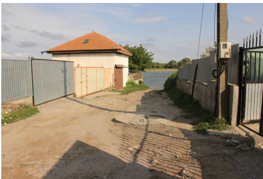
Fig. 4. Nufăru. Str. Ulmului. Vedere dinspre sud a zonei afectate de intervențiile din anii 2010, 2015 și 2017.