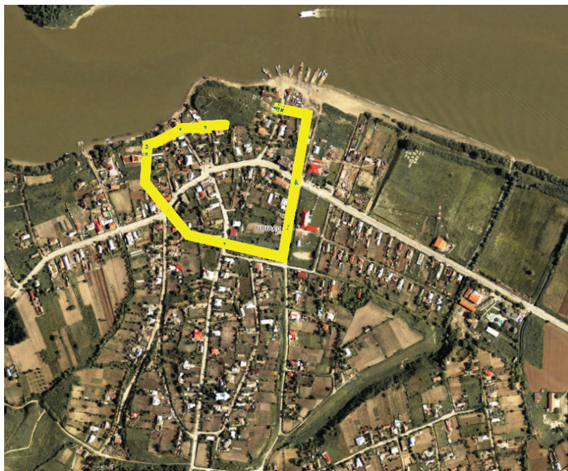
Fig. 1. Nufăru, jud. Tulcea. Situl arheologic din intravilanul localității.

desfășoară cercetări arheologice începând cu anul 1978 3 . Așadar, din punct de vedere al relației cu problemele de amenajare a teritoriului, situl de la Nufăru se află în intravilan, în mediu rural, fiind deopotrivă fortificat și deschis, conținând atât structuri solide, de zidărie, cât și perisabile, de pământ, suprapus, atât prin prisma structurii sale stratificate, cât și de așezarea contemporană, putând fi definit drept un sit arheologic de tip urban 4 în mediu rural.