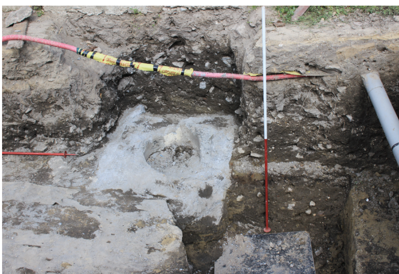
Fig. 11. Nufăru. Str. Ulmului, 2017. Tronson din curțina bizantină de nord, cu intervenția neautorizată din anul 2015 pentru reamplasarea stălpului electric. Vedere dinspre vest, după îndepărtarea părții de fundație modernă de deasupra zidului de incintă.