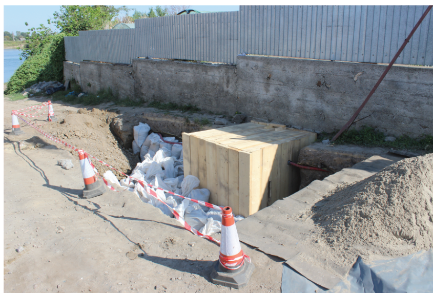
Fig. 15. Nufăru. Str. Ulmului, 2017. Tronson din cortina bizantină de nord. Caseta destinată intervențiilor reparatorii asupra porțiunii de zid distruse și pregătirea pentru astuparea cu pământ a suprafeței deschise.