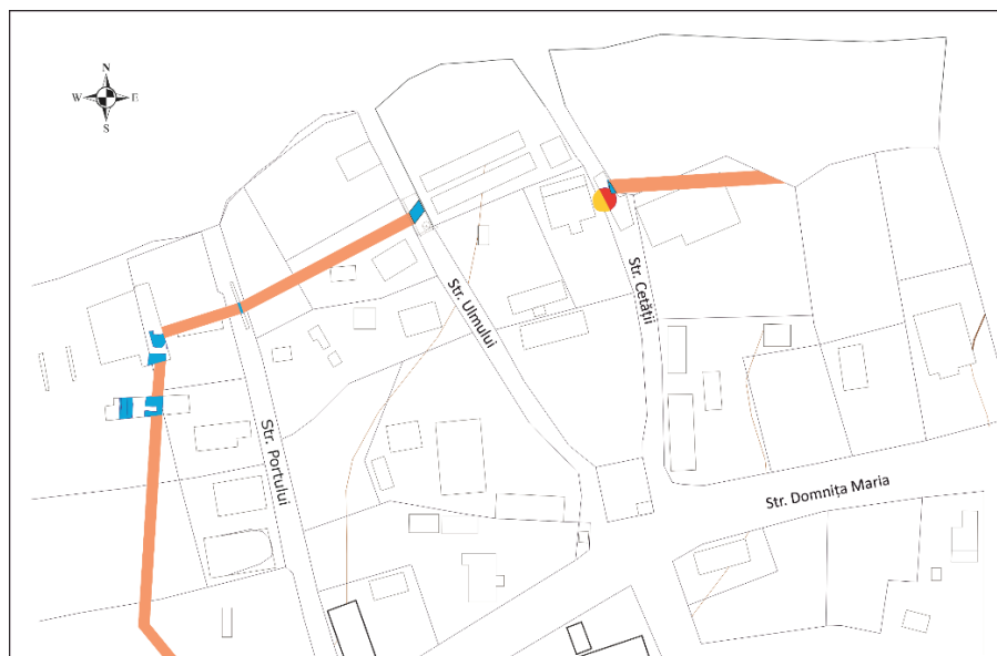
Fig. 2. Nufăru. Situl arheologic din intravilanul localității. Traseul reconstituit al curții bizantine cercetate prin tronsoane pe străzile Portului, Ulmului și Cetății. Zona afectată de intervențiile neautorizate din anul 2015.

săpate deja parțial (în mod neautorizat) pentru obținerea unui aviz favorabil realizării proiectului și finalizarea lucrărilor de reabilitare a rețelei electrice, precum și al asigurării asistenței de specialitate pe teren pe durata derulării lor, în măsura în care acestea ar mai fi presupus intervenții în subsol. În ciuda numeroaselor negocieri purtate cu reprezentanți ai Enel din Tulcea, inclusiv în prezența și la cererea autorităților locale, nu s-a procedat în consecință nici în cursul anului 2015, nici în cursul anului următor. Rețeaua electrică nu a fost reabilitată în porțiunea respectivă, deși casele pentru stâlpi erau realizate. Pentru a veni în întâmpinarea comunității locale, a fost chiar finalizată în august 2015 cercetarea din punct de vedere arheologic a casei săpate parțial din apropierea intersecției străzii Domnița Maria (= DJ 222 C) cu str. Ulmului, fapt neurmat de vreo intervenție constructivă. Între timp, caseta respectivă s-a transformat într-o groapă menajeră improvizată.