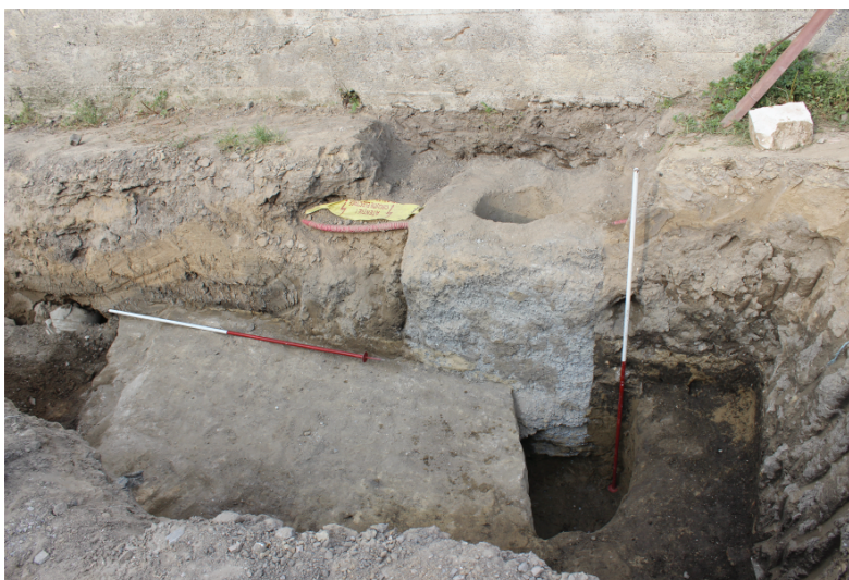
Fig. 10. Nufăru. Str. Ulmului, 2017. Tronson din curțina bizantină de nord, cu intervenția neautorizată din anul 2015 pentru reamplasarea stălpului electric. Vedere dinspre vest.