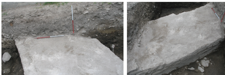
Fig. 6. Nufăru. Str. Ulmului, 2010. Tronson din curțina bizantină de nord cercetată. Vedere dinspre vest și dinspre sud.