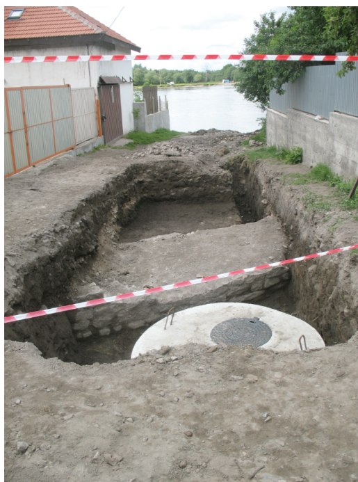
Fig. 5. Nufăru. Str. Ulmului, 2010. Tronson din curțina bizantină de nord cercetată, cu stația de pompare amplasată la sud. Vedere generală.