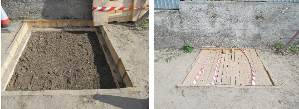
Fig. 17. Nufăru. Str. Ulmului, 2017. Tronson din cortina bizantină de nord. Vedere dinspre vest, după umplerea cu pământ a casetei cu protecție de lemn.