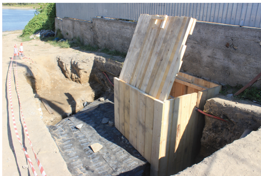
Fig. 14. Nufăru. Str. Ulmului, 2017. Tronson din cortina bizantină de nord. Protecție de lemn pentru caseta destinată intervențiilor reparatorii asupra porțiunii de zid distruse.