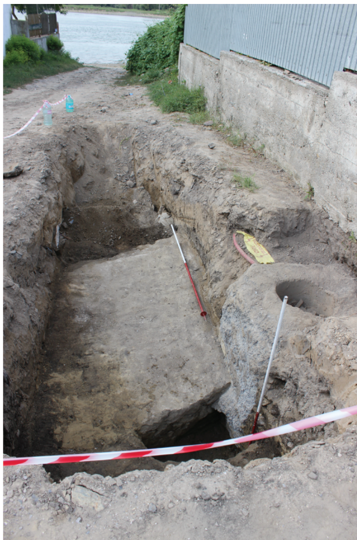
Fig. 9. Nufăru. Str. Ulmului, 2017. Tronson din curțina bizantină de nord, cu intervenția neautorizată din anul 2015 pentru reamplasarea stălpului electric. Vedere dinspre sud. Fundație modernă deasupra și în zidul de incintă, cu afectarea paramentului sudic al acestuia.