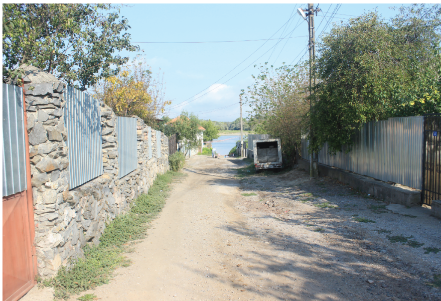
Fig. 3. Nufăru. Str. Ulmului. Vedere dinspre sud.