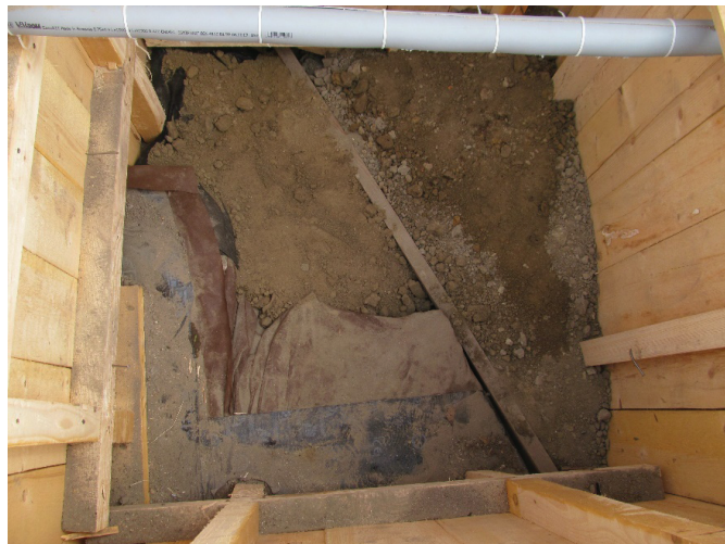
Fig. 16. Nufăru. Str. Ulmului, 2017. Tronson din curtea bizantină de nord. Vedere dinspre vest, după umplerea lacunei din zid cu pământ galben.

În acord cu rezoluțiile comisiilor de specialitate amintite, intervențiile au constat în umplerea lacunei din zid rezultate din distrugere, după îndepărtarea fundației moderne, cu materiale de protecție (geotex și pământ galben), precum și în umplerea cu pământ, până la actualul nivel de călcare al străzii, a casetei protejate cu lemn (fig. 16–17). Au mai fost necesare – la intervale mari de timp – operațiuni de completare cu pământ a zonei excavate, până la refacerea nivelului străzii de dinainte de intervenție. Actualmente, str. Ulmului este funcțională în totalitate, iar zona intervenției vizibilă în continuare, fiind semnalată prin capacul de lemn al casetei rămas accesibil la actualul nivel de călcare (fig. 18).