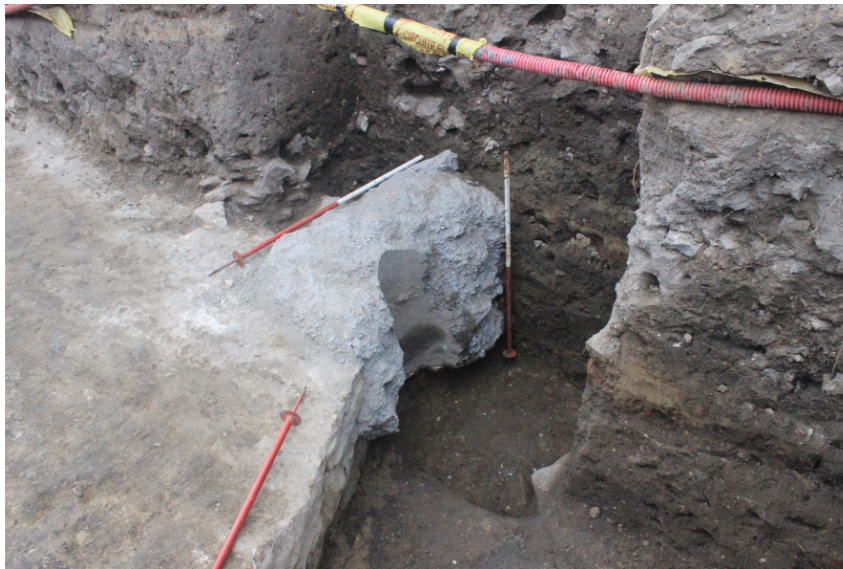
Fig. 12. Nufăru. Str. Ulmului, 2017. Tronson din cortina bizantină de nord, cu intervenția neautorizată din anul 2015 pentru reamplasarea stâlpului electric. Vedere dinspre sud-vest, după îndepărtarea părții de fundație modernă de la sud de paramentul zidului de incintă.