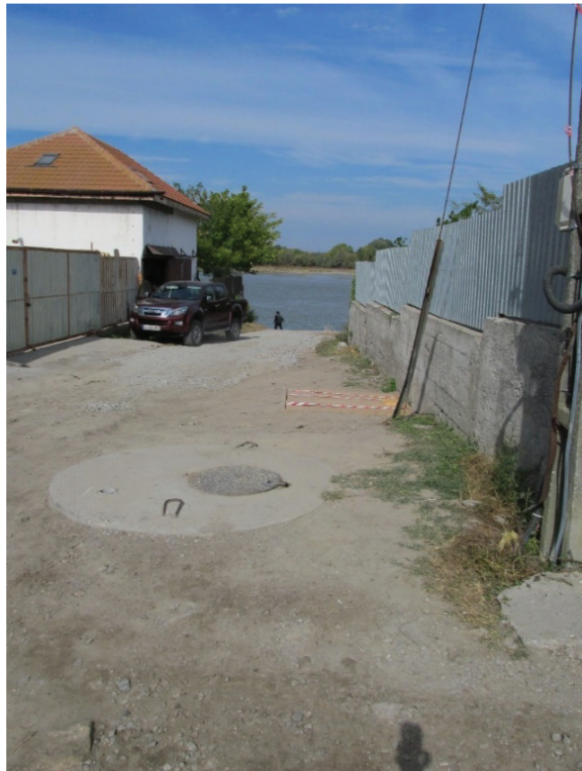
Fig. 18. Nufăru. Str. Ulmului, 2017. Tronson din cortina bizantină de nord. Situația actuală în zona intervenției.