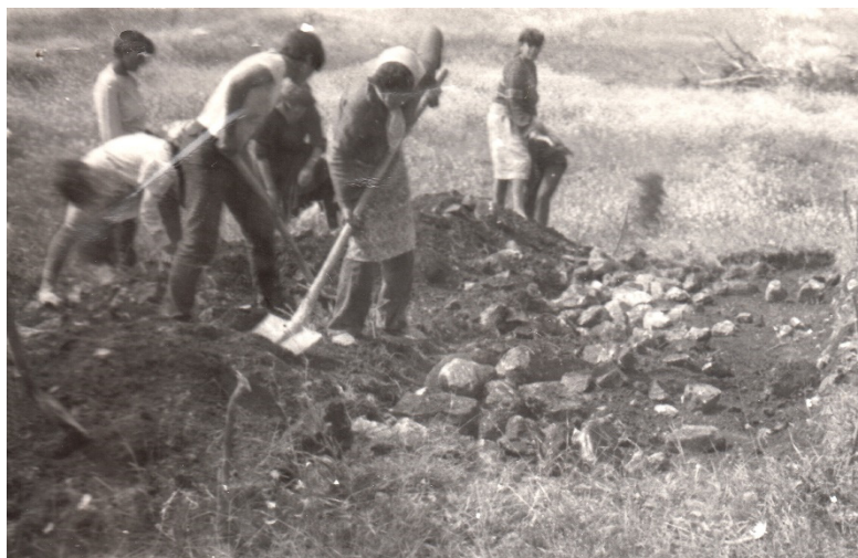
Fig. 2. Stoenеști – Valea Miriuței. Săpături de salvare, iulie 1989. Detaliu cu dezvelirea mantalei de pietre a unui mormânt tumular (foto T. Cioflan, arhiva documentară a Muzeului Județean Argeș).