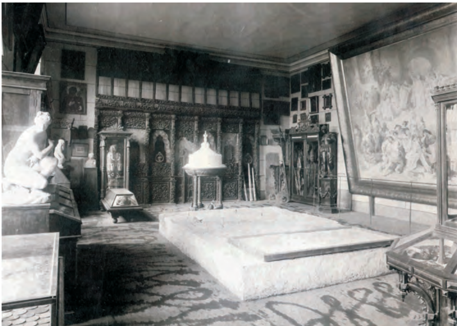
Fig. 2. Muzeul Național de Antichități. 1. Sediul de la Universitatea din București; 2. „sala mumiilor” (imagini din Arhiva IAB).