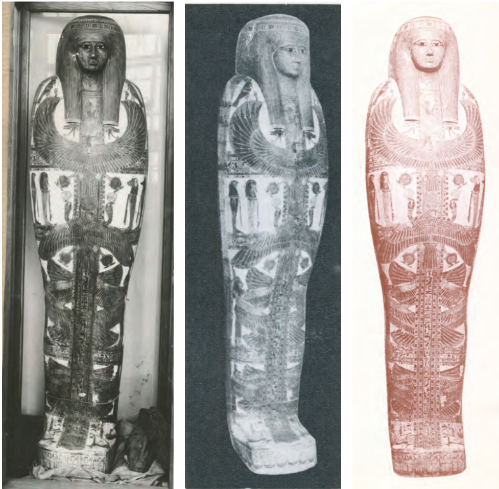
Fig. 4. Muzeul Național de Antichități. Sarcofagul mumiei lui Bes-An. 1. imagine din fototeca IAB; 2. după Dumitrescu 1968; 3. după Cihó 1999.

de antichități egiptene 147 , alături de vasele de lut din perioada predinastică (deci anterioară anului 3000 î.e.n.), de culoare roșie-închisă, cu excepția zonei de la gură care este neagră, pot fi văzute în expoziția permanentă (vitrina nr. 28): statuete de alabastru, de bronz și de piatră, reprezentând diferite divinități egiptene și faraoni-divinități; altele, de argilă și de caolină cu smalț colorat albastru și cu inscripții hieroglifice – una dintre ele reprezentând-o pe zeița Isis stând pe tron și ținându-l în brațe pe zeul Horus; un relief rectangular de piatră reprezentând două persoane mergând în procesiune, datează probabil de la începutul mileniului III î.e.n. 148 , un fragment de cippus al lui Horus cu basorelief