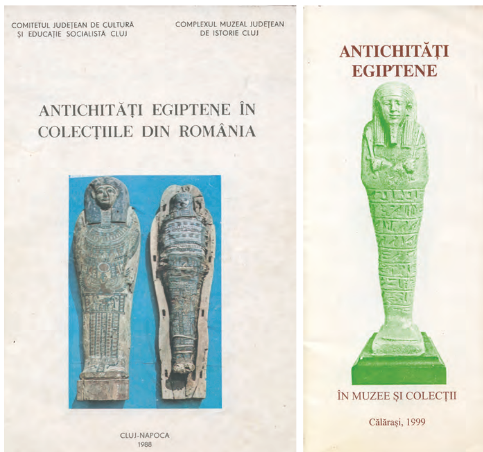
Fig. 5. Antichități egiptene din România. Cataloge de expoziție (Cluj-Napoca, 1988; Călărași, 1999).

ca și din catalogul aferent, în care sunt prezentate individual 29 de piese 185 și câteva în mod colectiv (amulete de divinități și zoomorfe) 186 , reiese clar faptul că piesele egiptene aflate la Facultatea de Istorie aparțin colecțiilor Institutului de Arheologie. Aceeași situație este valabilă și pentru expoziția din 1999, de la Călărași, în care au fost expuse 53 de piese 187 , în ciuda existenței unei publicații care se referă la „colecția