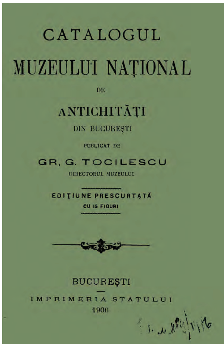
Fig. 1. Muzeul Național de Antichități. Catalogul din 1906.

pieselor egiptene la colecțiile respective, cu excepția artefactelor menționate la pozițiile 29–40, aparținând colecției Casotti 116 , probabil ultima intrată în patrimoniul instituției până la data întocmirii catalogului.