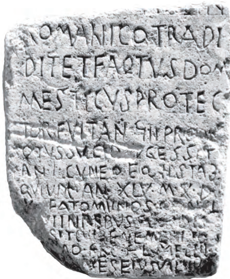
Fig. 3. Inscripția de la Sucidava, Dobrogea (reproducere după editori).

Sucidavei dobrogene la locul descoperirii inscripției. Alți doi cunei cu acest nume mai apar în Dobrogea (dar în provincia Scythia! ) la Cius și Beroe ( Notitia Dignitatum , Or. XXXIX, 14–15; vezi Fontes , II, p. 208–211). Trupa de la Sucidava apare în inscripție cuneus eq(uitum) II (secundorum) Stab(lesianorum) , spre a-l diferenția de alt cuneus din provincie.