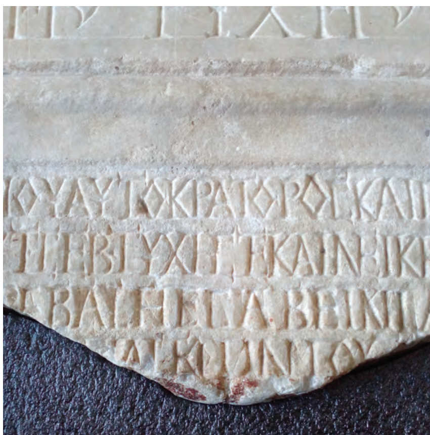
Fig. 2. Inscripția de la Tomis, ISM, II, 107 = ISM, VI.2, p. 30 (detaliu).

Grigore Tocilescu „corecta” în r. 2 Ἀντωνίου, completând în r. 3 numele împăratului Marcus Aurelius. Atribuirea corectă a fost făcută de Dionisie M. Teodorescu, care a stabilit că monumentul a fost dedicat împăratului Gordian al III-lea și soției sale, Sabina Tranquilina Augusta. În r. 5, Scarlat Lambrino citea ΑΙΕΟΥΝΙΟΥ: pe această bază, Arthur Stein reconstituia numele unui guvernator [? C]jaese(nnius) Vinius (Arthur Stein, Die Legaten von Moesien , Budapesta, 1940, p. 101); numele acestuia era însă citit Αἰ[λ]. Σαουινίου = Αἰ[λ]. Σαβινίου de către Jenö Fitz ( Die Laufbahn der Statthalter in der römischen Provinz Moesia Inferior , Weimar, 1966, p. 34). Dar Emilia Doruțiu-Boilă ( Über einige Statthalter von Moesia Inferior , Dacia N.S. 12, 1968, p. 403), care a revăzut piatra, citea în r. 5 ΤΙΑΙΕΩΝΙΟΥ, propunând în acest spațiu pe unul din guvernatorii cunoscuți din timpul lui Gordian al III-lea: pe Tullius Menophilus sau pe C. Pe[- -] (fig. 2).