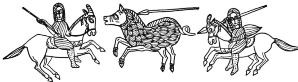
Fig. 2. Representarea desfășurată a scenei de vânătoare a mistrețului de pe cana nr. 159 din tezaurul de la Rogozen (după Nikolov 1986, p. 27).

Harnașamentul cailor tracici este bine cunoscut, atât prin zecile de seturi de piese de căpăstru depuse în morminte sau depozite, cât și prin numeroasele reprezentări de cai de tracțiune sau de călărie, rareori fiind păstrate și resturi din materialele lui organice. Totuși, doar o singură reprezentare de cai cu coarne poate fi recunoscută pe cana nr. 159 din tezaurul din secolul al IV-lea a.Chr. de la Rogozen 3 , fapt care necesită o explicație (fig. 2). Atestarea existenței cailor scitici cu măști și implicit reconstituirea căpăstrului calului de la Stâncești au fost posibile doar prin cercetările tumulilor din ținuturile siberiene, permanent înghețate, care au permis păstrarea părților de căpăstru confecționate din materiale organice. Deși astfel de condiții lipseau în Tracia, în această zonă sunt cunoscute mult mai multe reprezentări de cai încăpăstrați – pe monede, pe frescele camerelor funerare și pe piesele de toreutică –, decât în ținuturile scitice. De aceea, reprezentările de cai cu coarne de pe cana nr. 159 ar putea fi privite ca o dovadă a prezenței cailor scitici în zona triballilor. Această ipoteză are temeiurile ei, deoarece caii sciților erau mai mari, mai puternici și mai rapizi decât cei tracici 4 .