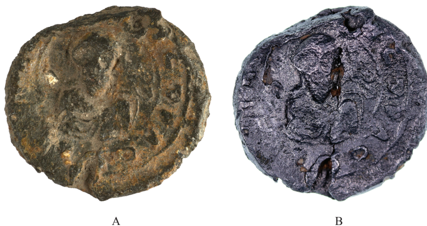
Fig. 3. Nufăru, jud. Tulcea. Sigiliul lui Constantin al X-lea Dukas. Revers (A – înainte de curățare; B – după curățare).

●●●●●●●-ΔΟΥΚΑΣ [†Κων(σταντῖνος) βασι(ι)λ(εὺς ὁ)] Δούκας 8 †Κωνσταντῖνος βασιλεὺς ὁ Δούκας †Konstantin Dukas împărat.