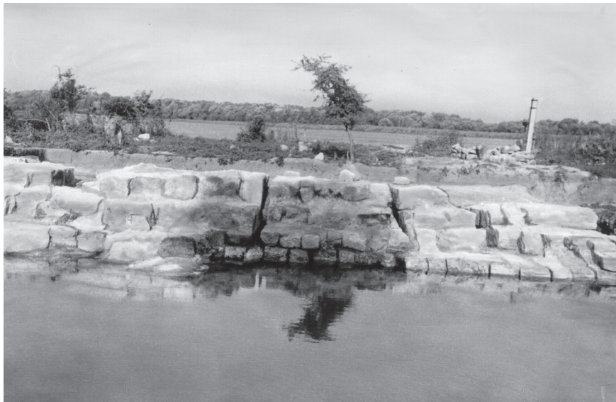
Fig. 5. Păcuiul lui Soare. Instalația portuară (după Diaconu, Vilceanu 1972).