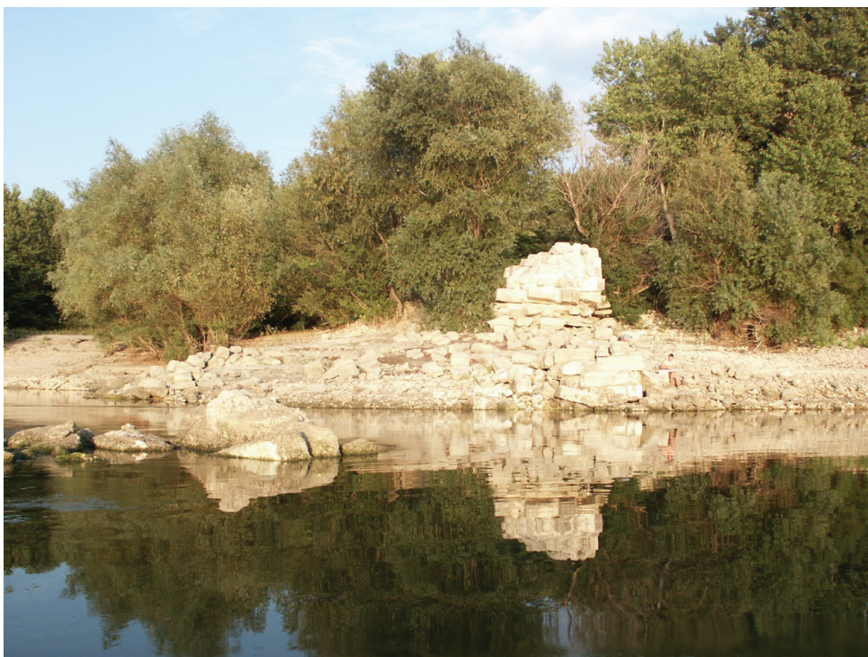
Fig. 2. Păcuiul lui Soare. Zidul de incintă nordic (după Diaconu et alii 2004).

Instalația portuară (debarcaderul) situat pe latura de sud-est a cetății (deoarece la data ridicării acesteia partea navigabilă a Dunării era constituită de brațul Ostrov) este un ansamblu constructiv cu lungimea de 24 m, reprezentat de o suită de platforme de piatră, având aspectul unei scări monumentale coborând spre apă în trepte, fiind flancat de două turnuri rectangulare și având o intrare impunătoare spre cetate, largă