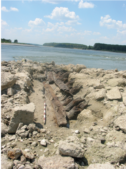
Fig. 3. Păcuiul lui Soare. Sectorul sudic, cu substrucția de lemn vizibilă (după Diaconu et alii 2004).