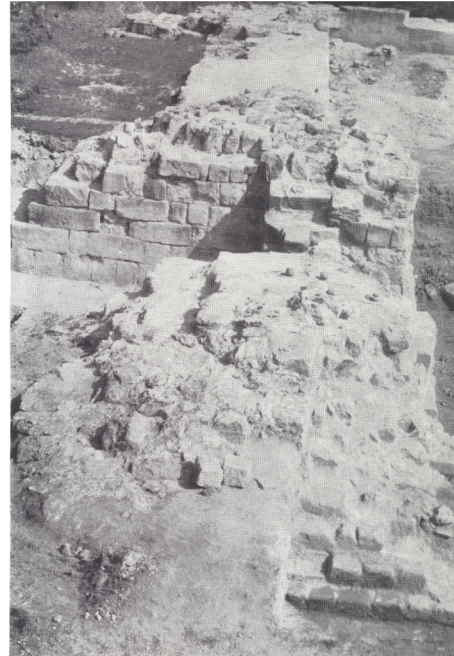
Fig. 4. Păcuiul lui Soare. Turnul-poartă (după Popa 1967).