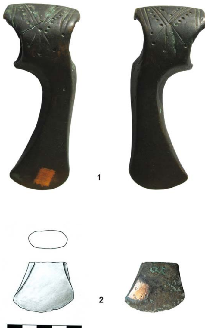
Fig. 2. 1. Toporul de la Horga, foto; 2. Fragmentul de topor de la Costișa, jud. Neamț, desen și foto.

Deși fragmentul este prea mic pentru a fi încadrat tipologic, totuși este de remarcat că atât dimensiunile și conturul tăișului, cât și traiectoria muchiiilor lamei constituie indicii pentru a presupune că forma inițială a toporului de la Costișa ar fi fost una zveltă, destul de apropiată de cea a toporului de la Horga. Prin această zveltețe și arcuire a tăișului, toporul fragmentar de la Costișa se diferențiază vizibil de topoarele Monteoru (inclusiv varianta Lopătari). Apartenența lui la un tip de origine transilvăneană nu ar fi o ipoteză de exclus, mai ales dacă avem în vedere prezența în