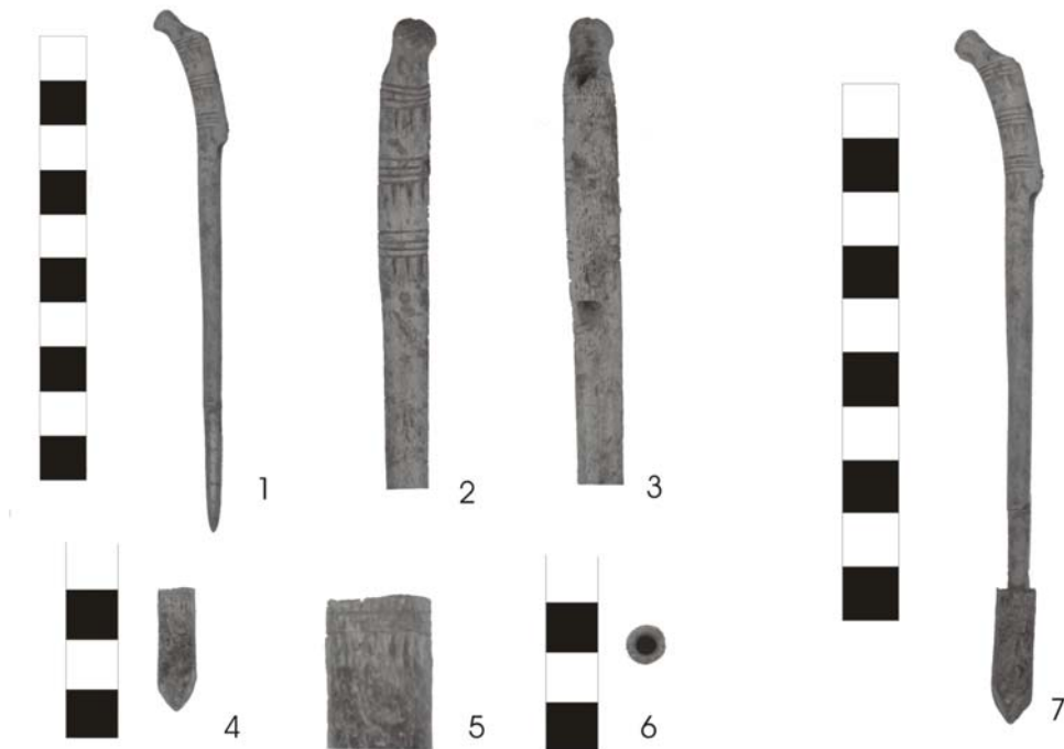
Tafel 2. 1–3 Knochennadel und Detailaufnahmen; 4–6 Nadelhalter und Detailaufnahmen mit den Brandspuren; 7 beide Objekte zusammengesteckt.