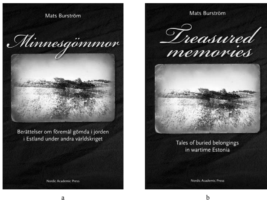
Fig. 3. Volum de arheologie a trecutului contemporan publicat în Suedia, în două ediții – suedeză (a) și engleză (b).

arheologic scris în limba maternă, oricare ar fi aceasta, are propria sa muzicalitate, invită la cunoașterea arheologilor și, de ce nu, a culturii respectivei țări. Este asemenea unui film în care limba vorbită contribuie la conturarea personalității personajelor lor și la imersarea privitorului în atmosfera narațiunii.