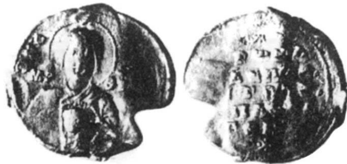
Fig. 3. Sigiliul lui Romanos descoperit la Durostorum–Dristra–Silistra .

Emitentul sigiliului de față poartă numele unui sfânt din secolul al VI-lea (Sfântul Romanos Melodul sau Imnograful – autor de imnuri religioase) 5 .