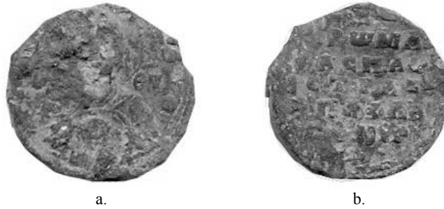
Fig. 1. Sigiliul lui Romanos, protospatharios și strategos , descoperit la Nufăru; a. avers; b. revers.

Personajul era guvernator al unei provincii din Asia Mică (în nordul Turciei de astăzi) și întreținea legături cu provincia de la gurile Dunării. Provincia Paphlagonia a fost reînțemeiată la începutul secolului al IX-lea ca provincie bizantină, fiind situată la vest de provincia Optimaton , învecinată la sud cu provincia Bukellarion , mărginită la est de provincia Armeniakon (fig. 2). Cunoaște o importanță din ce în ce mai mare la începutul secolului al XI-lea, mai ales după ajungerea pe tronul de la Constantinopol a lui Mihail al IV-lea Paphlagonianul, care reușește să refacă prestigiul puterii centrale și să crească importanța acestei provincii 3 . Prin urmare, guvernatorii acestei provincii aveau un rol important în cadrul administrației Imperiului Bizantin.