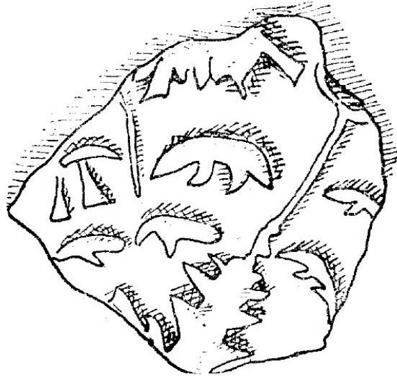
Fig. 4. Fragment ceramic descoperit la Cotnari (după Slătineanu 1938).