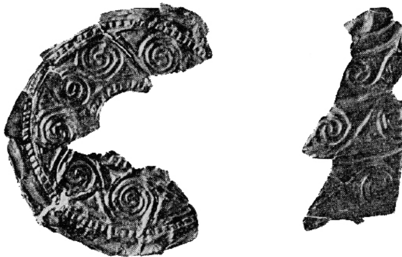
Fig. 5. Discuri ornamentate cu aur descoperite la Țufalău (după Tzigara-Samurcaș 1944).