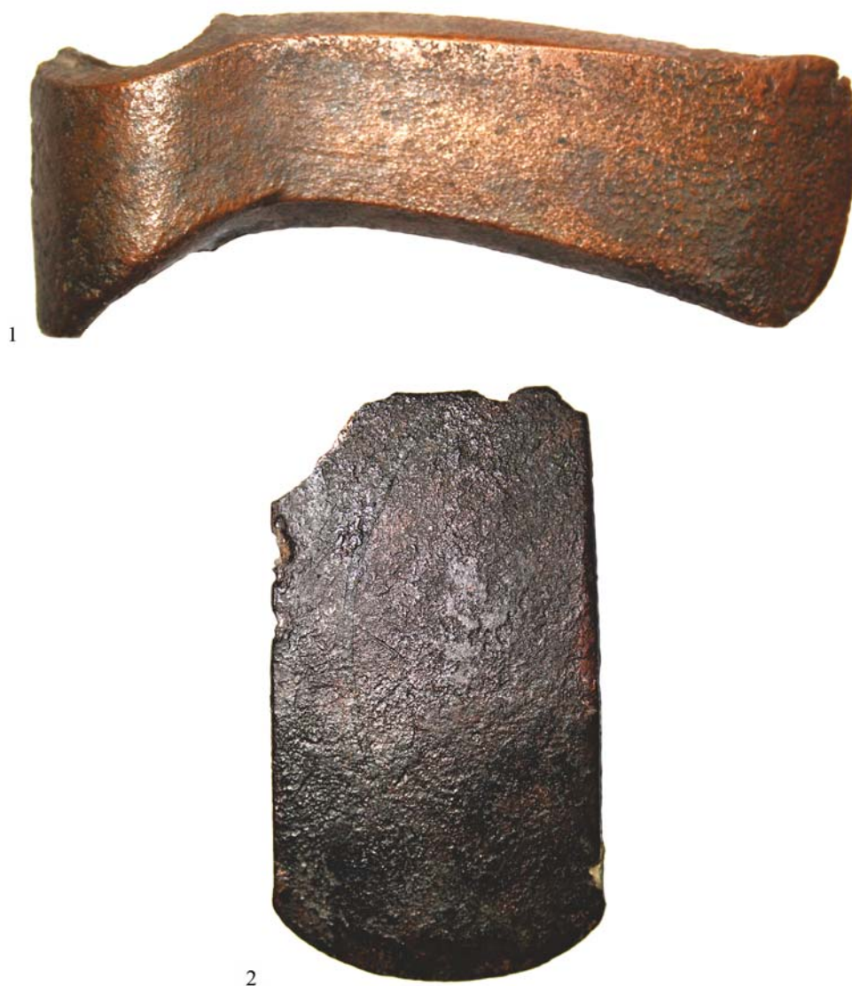
Fig. 3. 1. Toporul cu gaură de înmănușare transversală de la Preajba; 2. toporul plat de la Fărcașu de Sus (foto, scări diferite).

Prin anumite particularități tipologice, în principal prin modul în care au fost modelate ceafa și partea inferioară a manșonului, toporul de la Preajba se apropie de seria mai veche a topoarelor de tip Veselinovo (I) 8 . Se diferențiază, însă, de acestea prin secțiunea hexagonală a lamei. Cea mai bună analogie în ceea ce