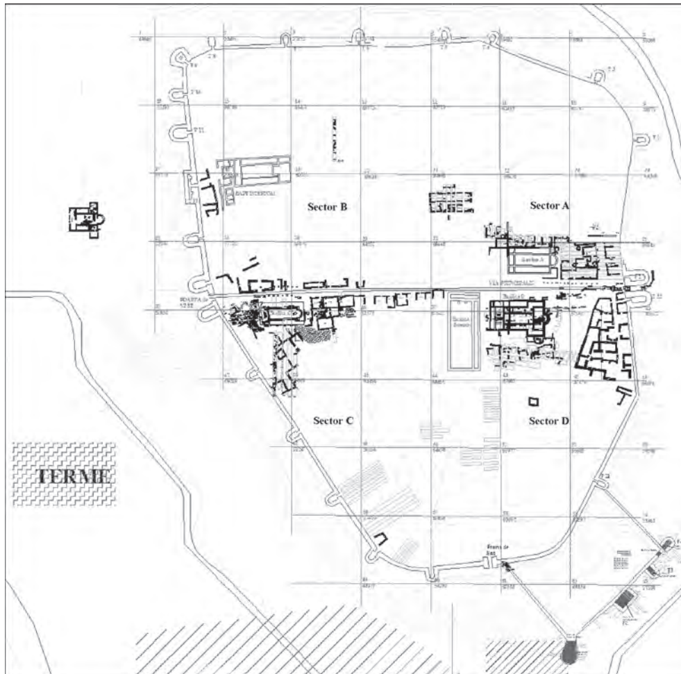
Fig. 1. Planul general al oraşului roman Tropaeum Traiani .