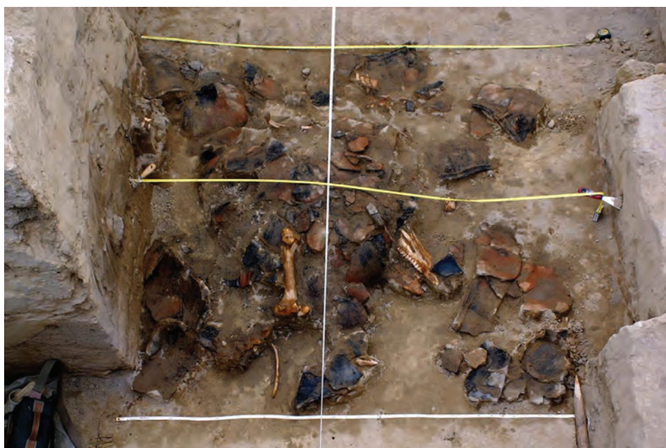
Fig. 2. Adamclisi – Platou Est . Complex descoperit în 2001.

Descoperirea, în profilul secțiunii S5/2000, a unui cap de cal (fără alte elemente ale scheletului), asociat cu 12 obiecte cu formă aproximativ circulară (cu diametre cuprinse între 6,5 și 7,5 cm), cu o impresiune alveolată pe una dintre fețe, confecționate dintr-un lut de proastă calitate, ars pe o parte, toate aparținând complexului 24/2002, a fost completată în anii următori (2001–2002) prin dezvelirea întregului complex arheologic menționat mai sus, care conținea și o cantitate mare de resturi cinerare – cenușă, cărbune, pământ ars (fig. 2).