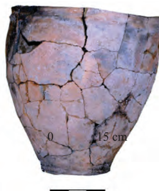
Fig. 3. Adamclisi – Platou Est . Vas de provizii.